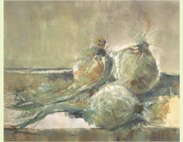
Cebollas , 2005. Acrílico sobre lienzo. ?? × ?? cm