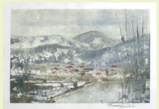
Torrecilla Nevada , ????. ????. ?? × ?? cm

Inauguración: Jueves, 3 de julio. 20 horas