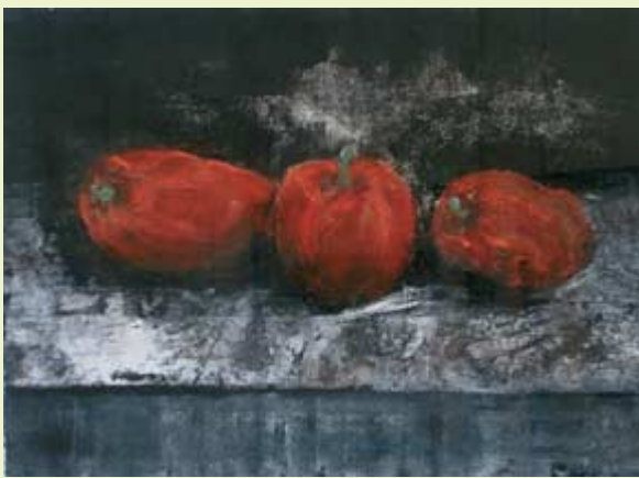
Pimientos , 2005. Acrílico sobre lienzo. ?? × ?? cm

Aunque dominaba todas las técnicas por igual, el entusiasmo de Beatriz Arbelo por el grabado es significativo así como determinante de sus repetidas presencias en «Estampa» y de su incursión en Estados Unidos, con su importante presencia en «Artexpo», de Nueva York, 2006. En este contexto, «Grabados Riojanos» es una muestra muy especial, en la que se unen la utilización de la técnica quizás predilecta de Beatriz y su gran debilidad sentimental por La Rioja. El Amor y la Belleza están, una vez más, presentes en todas las imágenes de los objetos y los paisajes de nuestra región que ofrece esta exposición.