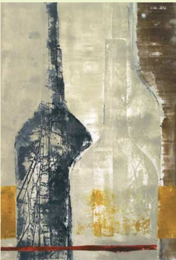
Botellas , 2005. Acrílico sobre lienzo. ?? × ?? cm